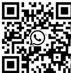
Código QR – Garantia